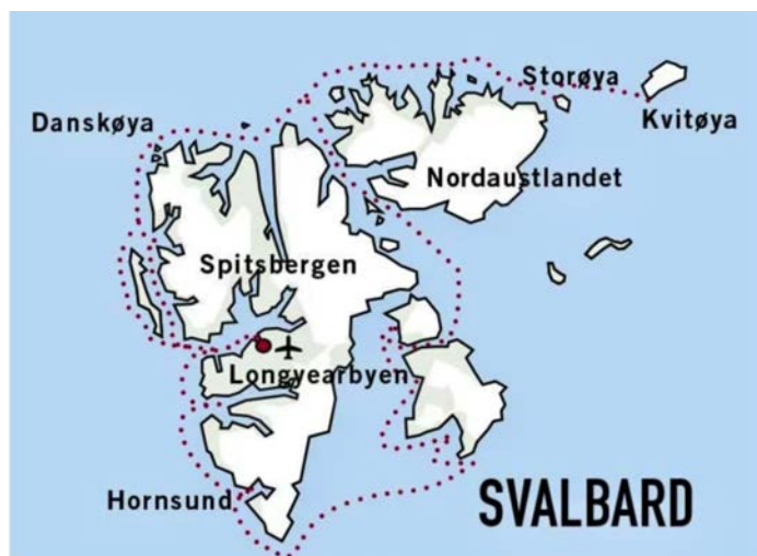
Die Fahrstrecke hängt vom Eisgang ab.