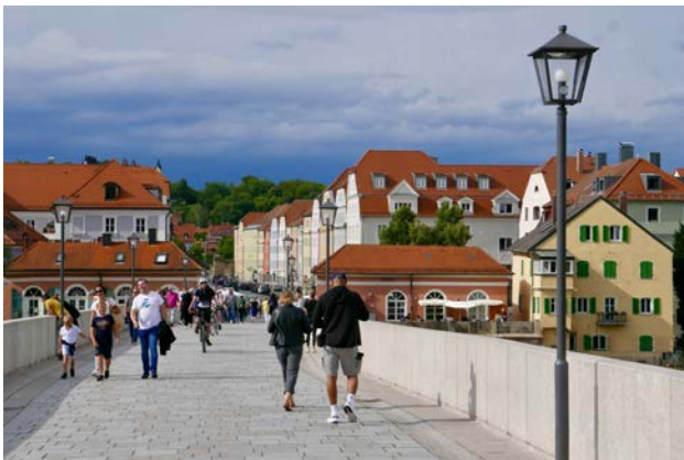
Die Steinerne Brücke, ein Wahrzeichen von Regensburg...

Das pittoreske Regensburg ist nicht nur Bischofs- und Universitätsstadt, sondern auch eine Hafenstadt! Nebst Kultur wartet der Hauptort von Oberpfalz/Bayern mit landschaftlicher Schönheit auf, die wir per Schiff erkunden. Wir fahren auf der Donau zu den interessantesten Sehenswürdigkeiten dieses Bezirkes: Oberhalb von Kelheim durch den Donaudurchbruch zum Kloster Weltenburg oder stromabwärts zur «griechischen» Gedenkstätte Wallhalla. Auf der Hin- und Rückfahrt nautische Abstecher zum Ammersee und auf die Donau in Ulm.