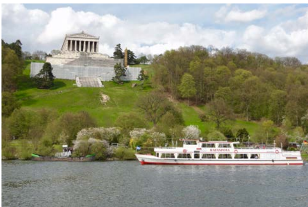
Schifffahrt zur Wallhalla

Ein Bus von Murer-Reisen bringt Sie bequem und gemütlich zum Hotel Luis Stadl in Regensburg. 7 Schifffahrten, wovon fünf auf der Donau, eine auf dem Ammersee und eine auf dem MDK. Ausflüge zum Kloster Weltenburg, nach Kelheim zur Befreiungshalle und zur Wallahalla. Alle Transfers, vier Führungen und vier Mahlzeiten auf Schiffen inbegriffen.