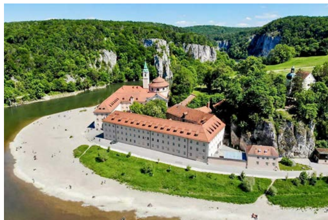
mit dahinter liegendem Kloster Weltenburg

Leistungen Busfahrten (gleicher Bus während der ganzen Reise) Drei Übernachtungen im Hotel Luis Stadl inkl. Frühstücksbuffet Alle Schifffahrten inkl. 2 Charterfahrten 2 Abendrundfahrten auf der Donau mit Abendessen & 2 Fahrten mit Mittagessen Begleitete Stadtführung in Regensburg und Ulm Eintritt und Führung Schifffahrtsmuseum Regensburg und Tempel Wallhalla Reiseleitung durch die Schiffs-Agentur