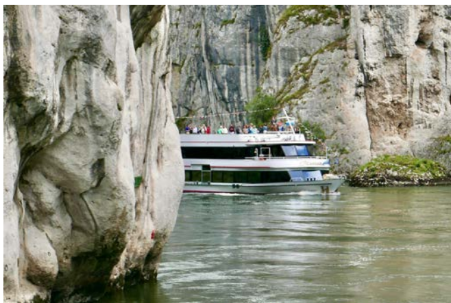
Landschaftlich imposanter Donaudurchbruch...