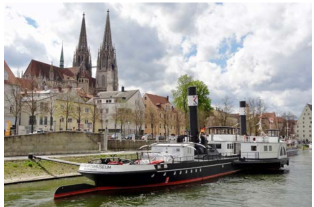
... wie der Dom und der Radschlepper Ruthof als Museum